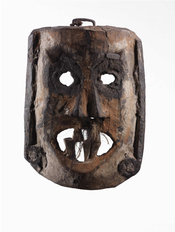
Masque comique Népal, XIX e siècle, bois, argile, fibres végétales, fer.