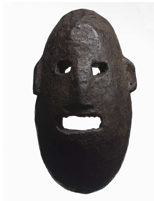
Couple de masques comiques Népal, montagnes moyennes, XIX e , bois à patine croûteuse noire © musée du quai Branly, photo Thomas Duval