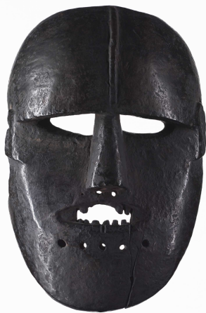
Masque, bois, Népal, XIX e siècle

Tous les masques ici présentés sont originaires du Népal. On en trouve, de types voisins, dans les régions attenantes, notamment vers l'ouest, dans la province indienne de l'Himachal Pradesh. Ce sont essentiellement les créations de groupes tribaux, à l'origine ni hindouistes ni bouddhistes, "mongoloïdes" de souche linguistique tibéto-birmane, établis dans les Montagnes moyennes ("Middle Hills") du Népal. Ces tribus, aujourd'hui en grande partie hindouisées, comme les Magar ou parfois, comme les Gurung et les Tamang, adeptes du bouddhisme, pratiquaient autrefois ou pour certaines, celles du groupe Kirant (Raï et Limbu), à l'est du pays, jusqu'à aujourd'hui, leurs religions animistes ancestrales associées à des rituels chamaniques. Une autre zone où l'on utilise des masques est l'ouest du Népal, peuplé d'Hindous de culture archaïque, les Khas, mêlés plus au nord à des populations d'affinité tibétaine. Dans toutes les zones aujourd'hui hindoues, l'artisanat est le fait de castes de spécialistes situées au bas de la hiérarchie sociale, comme les Kami (forgerons) ou les Sarki (tanneurs).