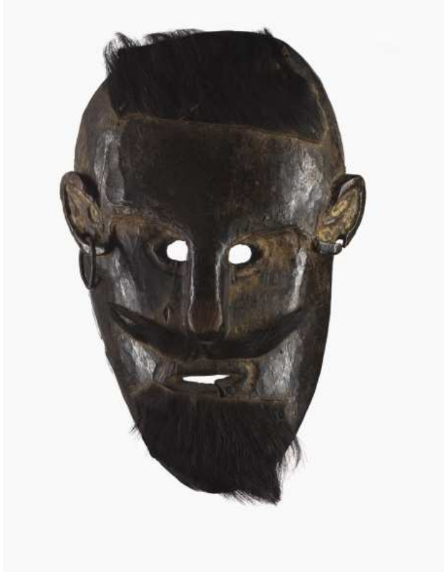
Masque anthropomorphe. Bois à patine brune, terre, peau de chèvre, crin, fer Népal, XIX e siècle

Ce masque, manifestement très ancien, est de facture sensiblement « réaliste », notamment dans la représentation des oreilles. Il pourrait figurer un esprit de la forêt ou un démon, mais son origine ethnique n'est pas établie.