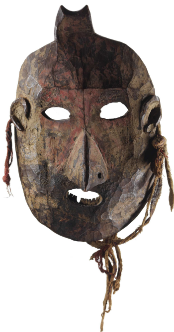
Masque figurant un oiseau mythique Ouest du Népal, XX e Bois, pigments ocre jaune et rouge d'argile et de sindur (enduit rouge)

Doté d'une huppe, de dents et (anciennement) d'un anneau de nez, à l'image des femmes des tribus, ce masque figure à n'en pas douter un personnage précis dont l'identité nous est inconnue.