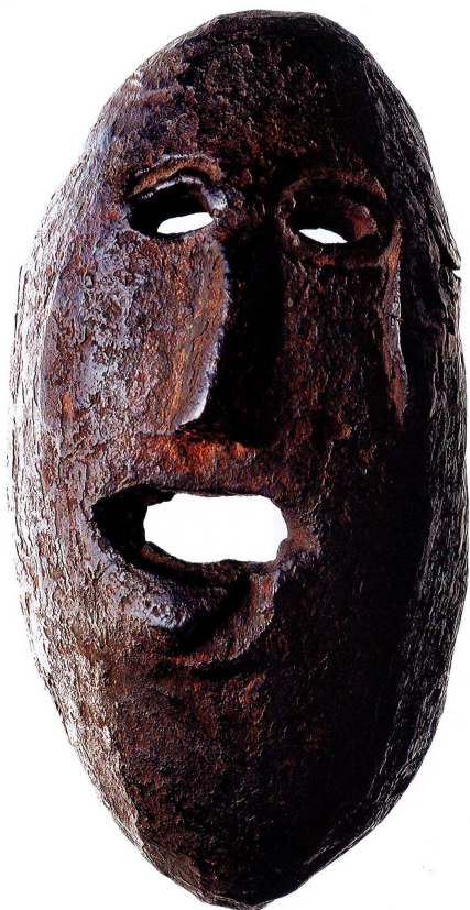
Masque anthropomorphe

Qu'est ce que c'est ? – Une patate qui espère le couteau, la trogne rouée de coups d'un ivrogne, un crachat dans le creux de la main, un éclat de visage, un coup d'œil qui nous porte un coup. Cette chose ressemble comme deux gouttes d'eau à une mauvaise rencontre. Nous sommes vus par quelqu'un que nous ne connaissons pas et qui se moque de nous. Je voudrais vous dire qui il est.