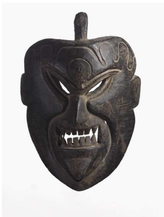
Masque à visage humain dérivé du type classique du « protecteur de la religion » Népal, aire tribale sous influence lamaïque, XIX e -XX e bois à patine sombre

Imaginez ce que c'était encore. Le Moyen Age, peu de trafic, des vaches partout, un feu d'artifice de choses jamais vues nulle part, visages, couleurs. Et puis, un dimanche de février 1982, dans la maison de Dawa, accrochées au mur, ces deux têtes monstres, ces deux gueules noires remontées du fond du puits du temps, le père et la mère. Beaux ? Laids ? Grotesques, sublimes. Au-delà des catégories. Forts, comme on dit parce qu'on ne trouve pas d'autres mots. Voilà, c'est comme ça.