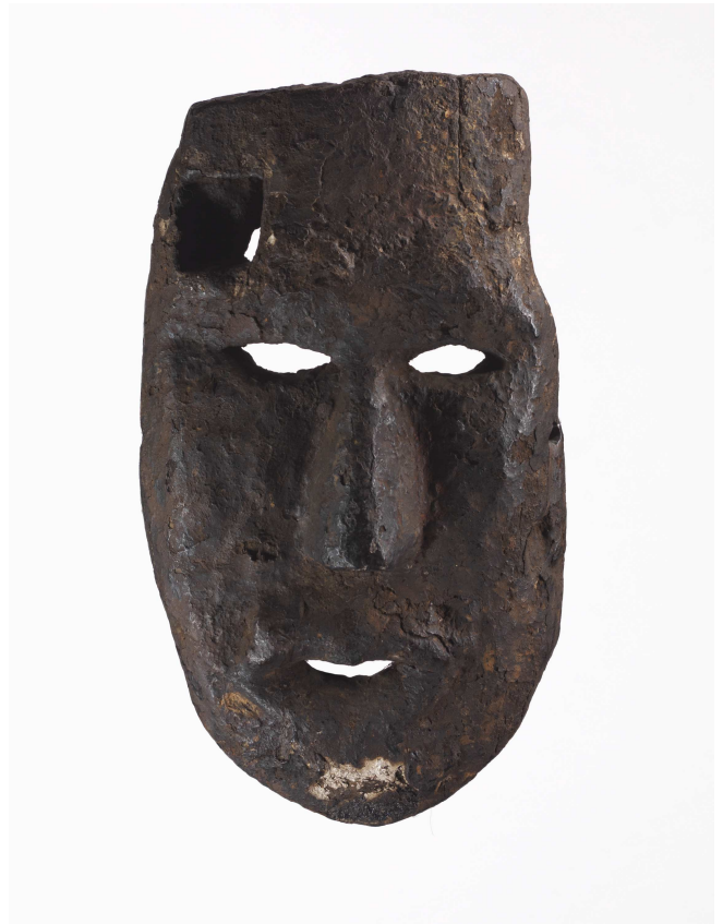
Masque anthropomorphe. Bois à patine croûteuse, traces de résine, d'enduits divers et de poils. Népal, aire stylistique Kirant, antérieur au XIX e siècle

La réponse est complexe. Les élites locales ne se sont jamais intéressées à la culture des tribus ni aux productions des castes artisanales. Beaucoup d'orientalistes, voire d'ethnologues, leur ont emboîté le pas sans en avoir conscience. Cela paraît difficile à croire, mais jusqu'à une date très récente, personne parmi les ethnologues n'a éprouvé le moindre intérêt pour l'étude de tels objets. Les choses sont en train de changer peu à peu. Mais pendant longtemps, ce sont des voyageurs, des collectionneurs, des aventuriers indépendants qui ont révélé l'existence de ces objets et les ont fait connaître à l'extérieur du pays. Ajoutons que le processus d'assimilation des tribus et le caractère privé, secret, voire clandestin des pratiques chamaniques et même des cultes ancestraux ont contribué à maintenir un certain mystère autour de l'existence et de l'usage de ces masques. Mais le cas est-il si rare ? Il a fallu attendre les guerres du Congo et du Biafra pour voir "sortir" au grand jour les statues Hema et Ibo, autrement plus monumentales que les masques népalais !